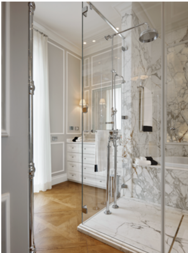
Dans la salle de bain principale, des textiles Frette pour Devon&Devon

Le petit hammam et les salles de bains ont été imaginés comme de véritables espaces de bien-être sophistiqués et originaux où le corps et l'esprit coexistent avec le style et la philosophie de l'habitat de Devon&Devon.