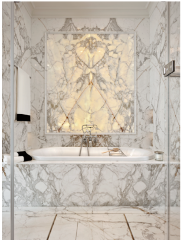
Armaturen und Duschköpfe von Devon&Devon im ausgesuchtem Retro-Design

Das große Hauptbadezimmer bietet eine außergewöhnliche Kulisse und empfängt die Eigentümer in einer gemeinsamen Umgebung, in der jedoch jeder einen exklusiven und persönlichen Raum hat: die Waschbeckenmöbel für sie und ihn, die zwei großen Duschköpfe, die zwei Fenster, die zwei kleinen Räumlichkeiten mit Toiletten und die zwei Handtuchwärmer Bacchus im Retro-Stil. Dieser Raum für zwei Personen entfaltet seine perfekte Symmetrie um die große zentrale Badewanne herum. Sie steht zwischen hellen Wänden aus extra klarem Glas und Calacatta-Marmor, dessen Platten so dünn sind, dass sie fast transparent werden und suggestive Lichtspiele im hinterleuchteten Teil ermöglichen.